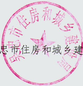
吴忠市住房和城乡建设局