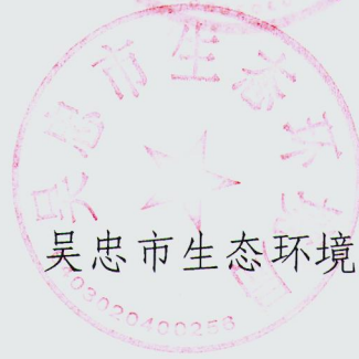
吴忠市生态环境局