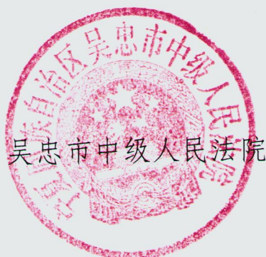
吴忠市中级人民法院