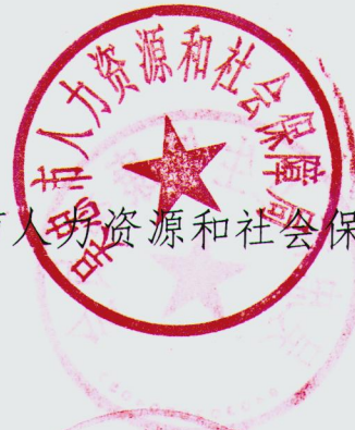
吴忠市人力资源和社会保障局