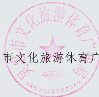
吴忠市文化旅游体育广电局