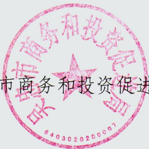
吴忠市商务和投资促进局