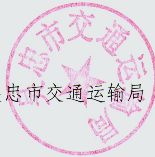
吴忠市交通运输局